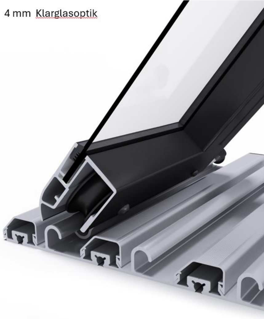
4 mm Klarglasoptik